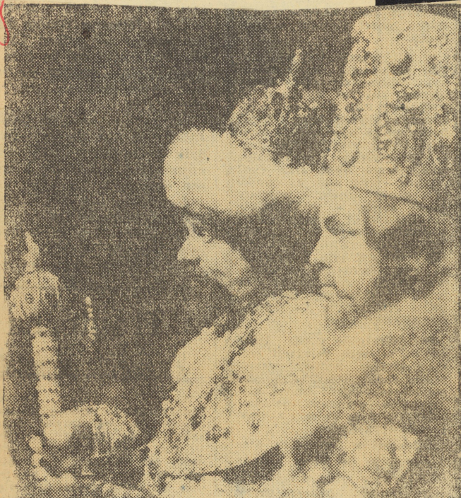
PREMIERA „BORYSA GODUNOWA” WYDARZENIEM ARTYSTYCZNYM STOLICY